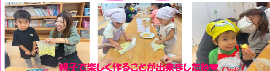
親子で楽しく作ることが出来ましたね♥