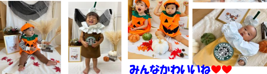
みんなかわいいね♥♥