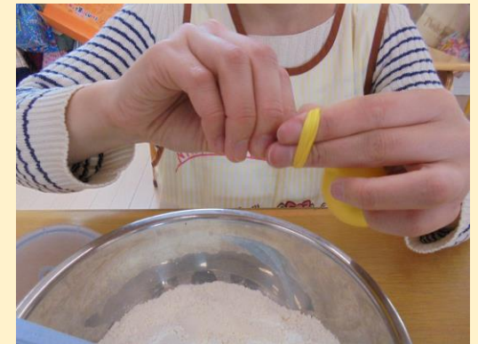
⑤小麦粉を入れたら風船を縛ります。