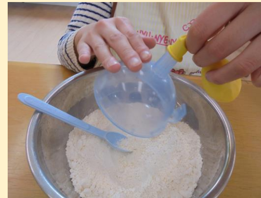
④残った粉はボールに戻します。