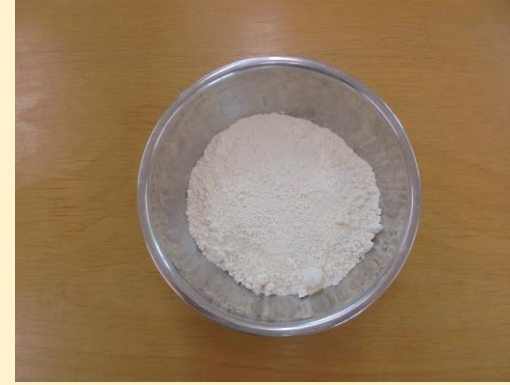
②ボールに小麦粉を入れます。