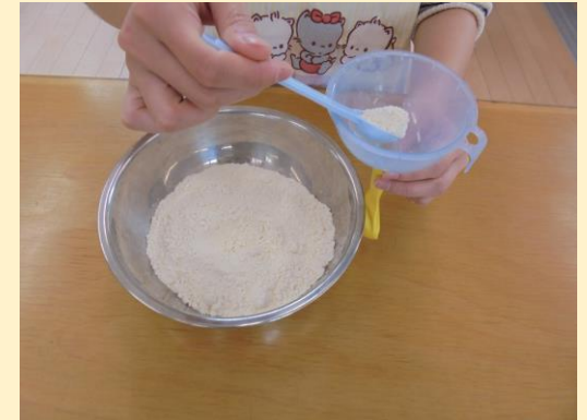
③小麦粉を風船に入れていきます。